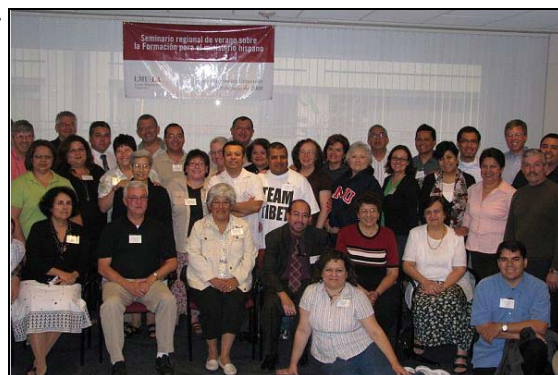
Participantes del Seminario Regional del Verano 2008

desarrollar pautas para programas de formación en Español que ofrecerá crédito o certificación transferida/trabajo de cursos en diócesis e instituciones en California y Nevada. El grupo espera reunirse de nuevo el siguiente verano.