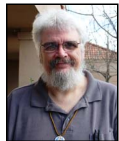
Director: Claude Muncey Ext. 108

usted le interesa, por favor llámeme al (559) 488-7474 ext.108.